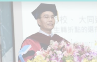
戴正吳 日本夏普會長